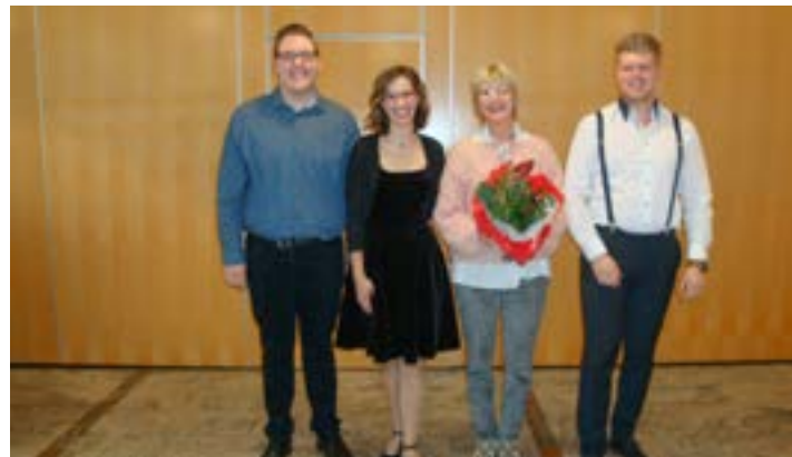
Das Regensburger Liedertrio mit einer ihrer musikalischen Wegbegleiter.