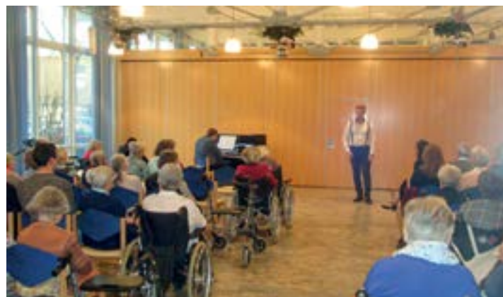
Die Bewohner genießen die musikalische Darbietung zu Ehren von Ludwig van Beethovens 250. Geburtstag.