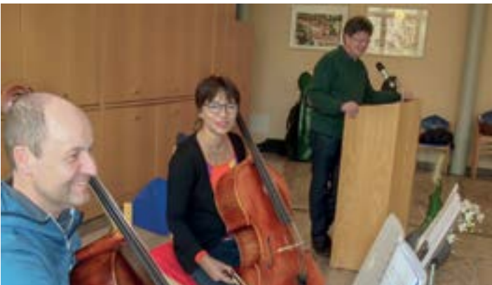
Musikalisch wurde der Nachmittag umrahmt mit Musik aus der Barock- bis zur Neuzeit.